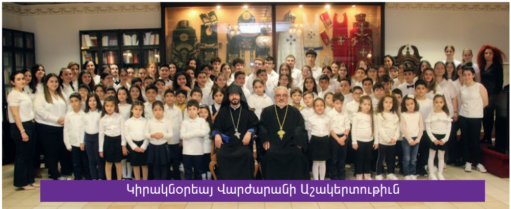
Կիրակնօրեայ Վարժարանի Աշակերտուքին