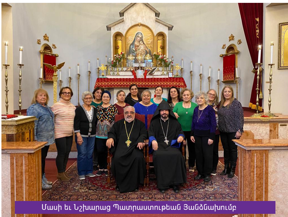
Մասի եւ Նշխարաց Պատրաստութեան Յանձնախումբ