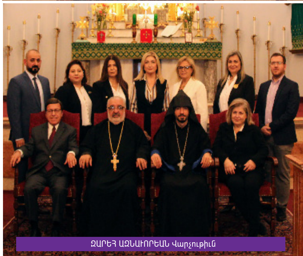
ՋԱՐԵՅ ԱԶՆԱԻՐԵԱՆ Վարչութիւն