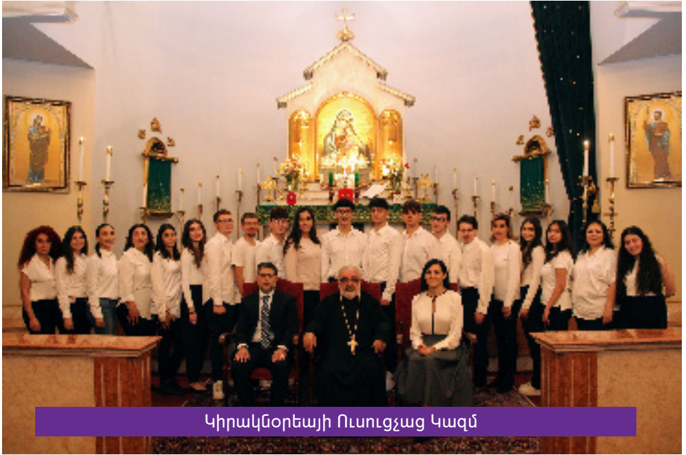
Կիրակնօրեայի Ուսուցչաց Կազմ