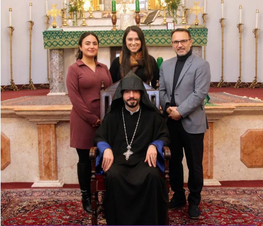
Քրիստոնեական Դաստիարակչական Յանձնախումբ